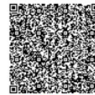
VERIFICACIÓN DE DATOS

G6W5N9rkBsalO/30ok5cw==:dllicAl2pQg8t49Azu9vbfew0+6evEasQy/INBCJSNODukGM+REYUyWDIqgrJTXnsQWdoozFrAUNJLxoJTVUEBRB-wUdVZVnYsv2Xx7wP2mQ3LXGPMAY/qbilck+4hIxRgwGt/oCRpm6e6oGB80aQDM7Ju56xGT/Lz7UPKcgx74XrXhFPuEa5j-Gog7T8mW05vjJK26A5Q06m3of0yEjoX5/DwFFzwoDqBEOVJ0ejg4Pj3fbsghUvLXEAYMQAej5+WRd5zUlh5XDboen7trGRUTZcshaW6ND-Md09z634cp8Tvo0MD825280qX5r1Xy